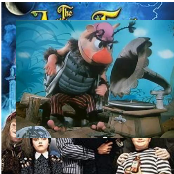
Včelí medvídci - Pučmeloun